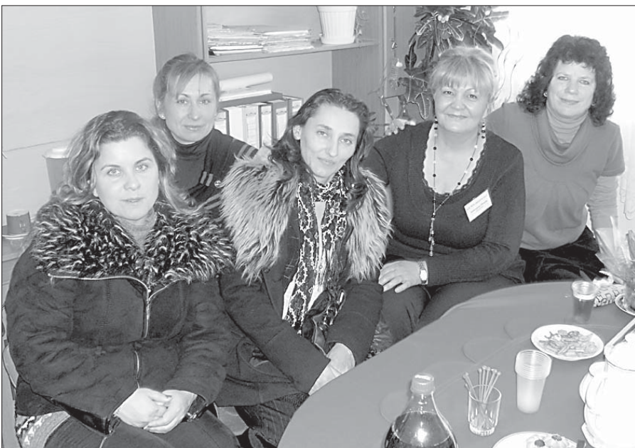
При обмяната на опит - практикум детските учителки почерпиха важни познания за ежедневната си работа с децата.

Сега в Ц ДГ №34 се осъществява проект по процедура 33.5 - 2009 г. „Заедно за равен старт в училище“ по програма №1 на ЦОИДУЕМ - гр. София. Макар че нашият проект е по втора програма и няма други ДГ, които да работят по нея, и в двете програми има много общи