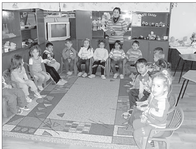
Клуб „Малки журналисти“

На 18.02.2011 г. в ЦДГ „Пролет“ - с. Цонево, се