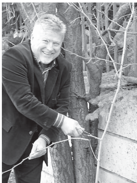
Кметът на общината заряза лозата в Дома на културата