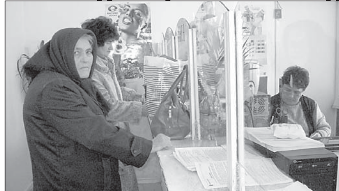
Част гражданите на Дългопол предпочитат да платят цялата дължима сума за съответните данъци, ползвайки 5% отстъпка.

миналата година промени в Закона за местните данъци и такси и за публичните съдиизпълнители, контролът значително се е затегнал. Очаква се и тази година да има подобни санкциониращи действия.